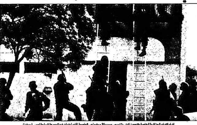
القوات الجزائرية العاصمة يقتلون 177، بينهم سيوكتال، بموتلي العاصمة التي احتاجت بها الجموع المسلحة أس (بريد)

القوات الجزائرية، التي وصلت إلى العاصمة الجزائرية في وقت مبكر من صباح اليوم، قد قتلت ستة أشخاص في مدهامات لقاعدة اصولية قرب المطار. وقد تم الكشف عن هذا الخبر من قبل صحيفة «الديلي ميل» البريطانية، التي ذكرت أن القوات الجزائرية قد قتلت ستة أشخاص في مدهامات لقاعدة اصولية قرب المطار.